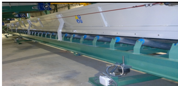
CINTA COLECTORA-PESADORA/ CONVOYEUR COLLECTEUR A BANDE-SERVANT A PESER