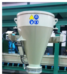
BASCULA-MEZCLADORA PARA PESAR EL CEMENTO BASCULE-MELANGEUSE POUR LE PESAGE DU CEMENT