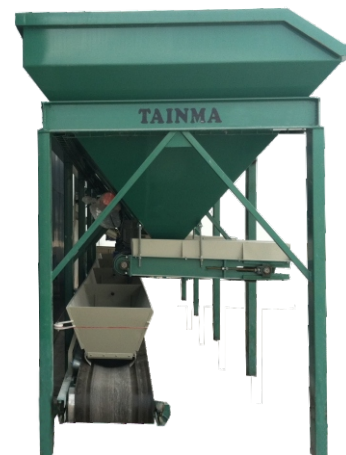
TOLVA DE ARIDO CON CINTA EXTRACTORA TRÉMIE ARIDE AVEC CONVOYEUR EXTRACTEUR

El secreto de una buena mezcla está en la perfecta dosificación y homogeneización de todos sus componentes, en todo y en cualquier momento del proceso de elaboración. Debido a su total automatización el Hormigonado TA1-2A permite seleccionar una fórmula (entre más de 9.500) y mantener la mezcla homogénea durante todo el ciclo. El hormigonado automático TA1-2A cuenta para ello con todo el equipo necesario para realizar todas las funciones exactas.