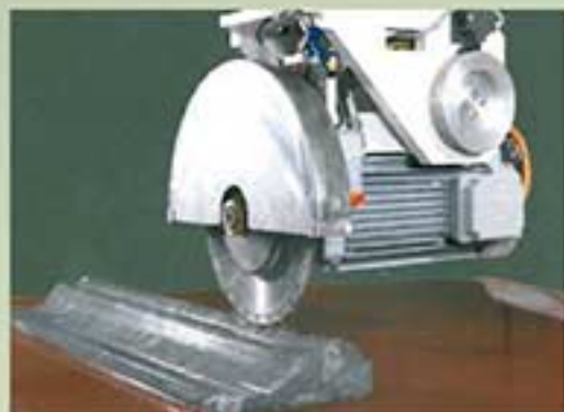
CORTES DE MOLDURAS / COUPES DE MOULURES