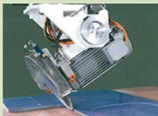
CORTES CON GRADOS / COUPES AVEC DES GRADES