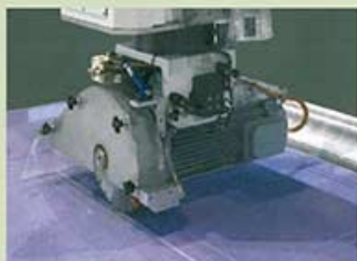
CORTES MANUALES Y AUTOMÁTICOS COUPES MANUELLES ET AUTOMATIQUES