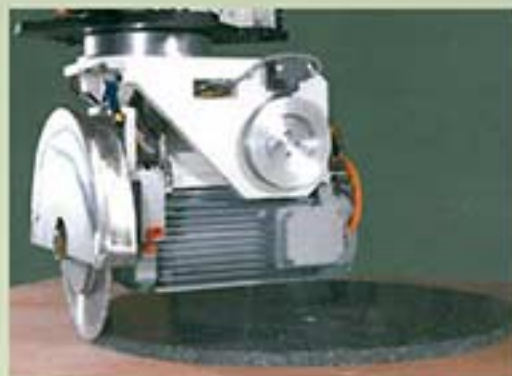
CORTES CIRCULARES / COUPURES CIRCULAIRES